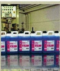
40 % des produits de la savonnerie sont écologiques. D'ici 2018, 70 % d'entre eux le seront.