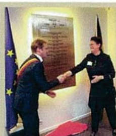
Huit générations de la famille Pollet se sont succédé à la tête de la société et s'y trouvent toujours.