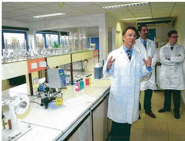
Dans le laboratoire de Pollet, des ingénieurs mettent au point de nouveaux produits.