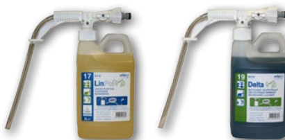
Existe depuis peu en système POD (prêt à doser)

Le DELTA est un détergent agréé pour le contact alimentaire qui possède un pouvoir dégraissant important. Son utilisation participe à l'entretien de la protection créée par le LINPOL®GREEN lors du nettoyage.